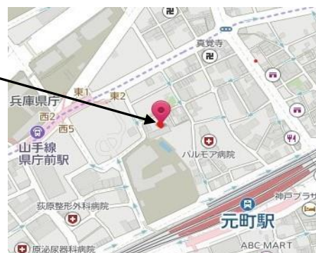
神戸元町北会館地図